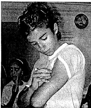
Estos jóvenes se inyectan la insulina que precisan.