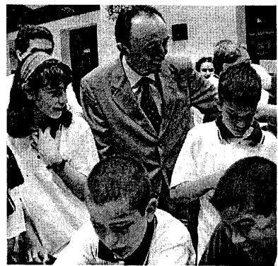
Los niños realizan manualidades en el campamento.