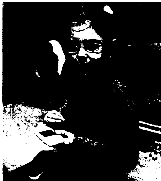
PREVENCIÓN. Es importante realizar un control de la enfermedad.

nece a la población de riesgo puede solicitar en la farmacia que le hagan las pruebas para comprobar si es o no diabética. En las oficinas farmacéuticas se realizará una extracción de sangre y en el caso de detectarse niveles elevados de azúcar en la sangre se derivará el paciente al médico del centro de salud correspondiente para que confir-