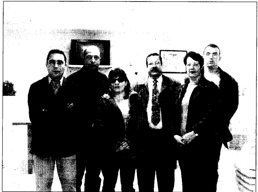
La actual Junta Directiva momentos antes de celebrar una de sus reuniones