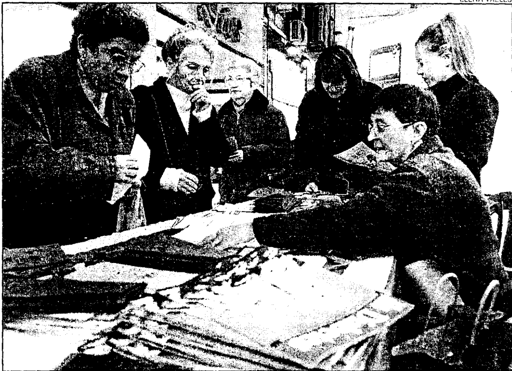
La Asociación de Diabéticos de Lleida instaló ayer una mesa informativa en la plaza Sant Joan.

En Lleida se calcula que hay actualmente unos 21.000 enfer-