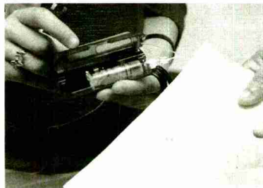
DEPÓSITO. La insulina se guarda en la bomba.