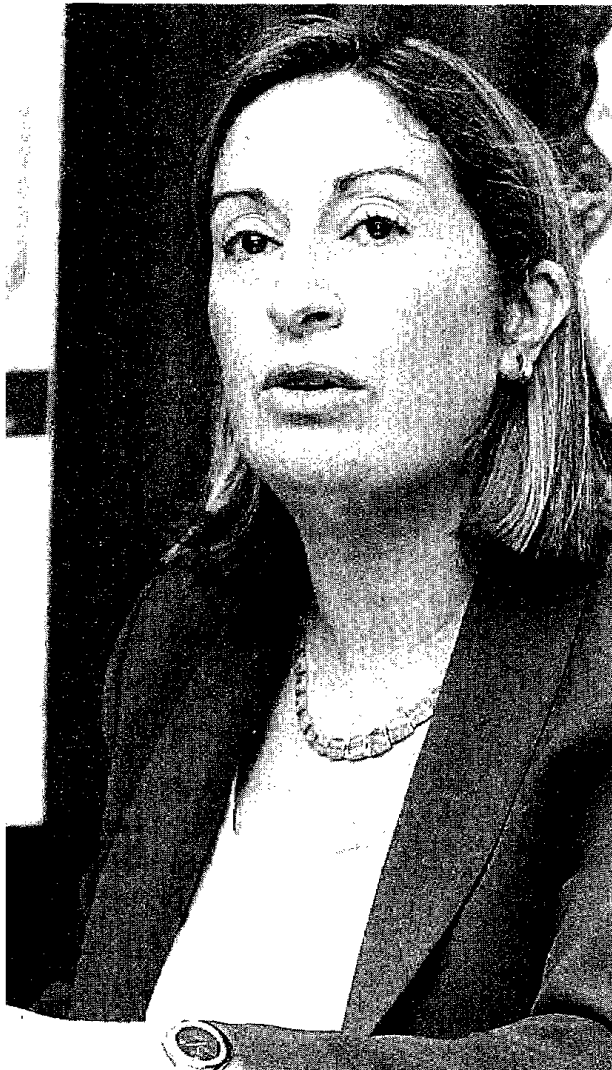
Ana Pastor durante expresó ayer sus dudas sobre el proyecto.

La senadora e investigadora granadina revela el malestar existente entre la comunidad científica por la política del PP de dilatar el derecho a estas investigaciones: «No sólo no reciben dinero para sus trabajos, sino que la gestión en investigación ha sido nefasta. El sentimiento es generalizado».