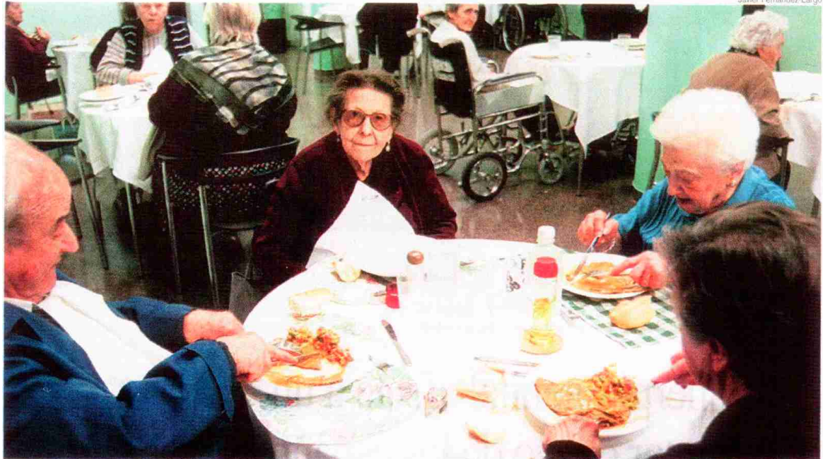
LA ALIMENTACIÓN es una de las claves para vivir más y mejor. A partir de los 40 años es necesario reducir el aporte calórico, porque el metabolismo se hace más lento

También en ratones, la restricción calórica, junto con suplementos dietéticos de ácido fólico, pueden reducir el daño neuronal y prevenir de las patologías neurodegenerativas, según las investigaciones del NIA. Aunque estos datos no se pueden hacer extensivos a los seres humanos, por falta de evidencias, los investigadores señalan que existen estudios epidemiológicos en los que se advierte que el riesgo de padecer la enfermedad de Alzheimer o de Parkinson se incrementa en los individuos que si-