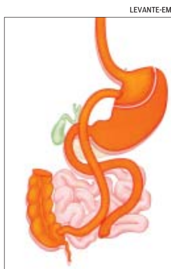
Después de la intervención.

«Al no pasar el alimento por el estómago, el paciente deja de tener apetito porque el paso de la comida genera unas hormonas (la grelina) en la pared del estómago que despiertan las ganas de comer y, así, al suprimir el tránsito de comida los pacientes se sacian antes», explicó Ortega que precisó que, tras la intervención en la que el estómago se reduce a una pequeñísima porción, el alimento se dirige sin jugos a la parte final del intestino a través de la co-